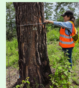
Fotografía: Observación de muestra botánica prensada y secada (izquierda) y determinación del diámetro a la altura del pecho (DAP), (derecha).

3. Relación con el proceso productivo forestal. La metodologías propuestas considera el monitoreo biológico en base a las actividades de cultivo del bosque, que están esquematizadas en el "Protocolo de Silvicultura" que la empresa Sansone implementa, para racionalizar las actividades silvícolas en función del tiempo y desarrollo alcanzando por la evolución del estado vegetativo de los rodales.