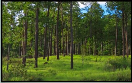
Fotografía: Bosques de pino de los planes de manejo de Sansone.

Las consideraciones para poder realizar monitoreos de especies vegetales son la identificación de los recursos, las finanzas que se dispongan y retos que se deben asumir, como también la actualización constante de información.