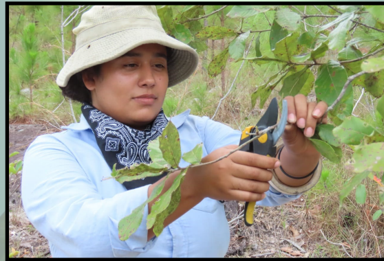
Fotografía: Con una tijera podadora, se extrae una porción de una rama para obtener una muestra botánica adecuada.

De igual forma, permite anticipar la potencialidad de impactos adversos causados por las actividades forestales en la composición florística previniendo estrategias de mitigación y reducción de daños que faculte la conservación de los ecosistemas.