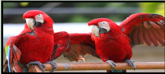
Ara macao (ave nacional de Honduras)

La familia de los Psitácidos constituye un diverso grupo de aves presentes en Honduras. A esta familia pertenecen especies como los pericos, loros y guaras como el ave nacional. En Honduras se cuentan con 17 especies de la familia Psittacidae, las cuales se caracterizan por su plumaje colorido, su carisma y la capacidad de algunas especies de vocalizar sonidos y repetir palabras, eso las ha convertido en aves vistas para las personas, por lo que son especies altamente demandadas en el mercado negro de fauna y traficadas de forma ilegal.