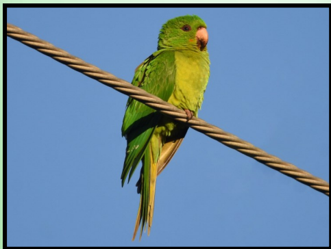
Psittacara holochlorus

Dentro de las áreas de manejo forestal pertenecientes a la empresa Sansone, se han registrado 5 especies de Psitácidos: Psittacara holochlorus , Eupsittula canicularis , Eupsittula nana , Amazona albifrons , Amazona autumnalis .