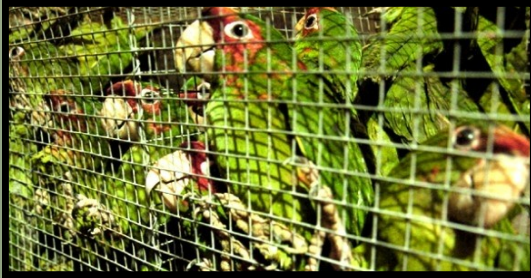
Individuos victimas del trafico ilegal de especies

Según la Unión Internacional para la Conservación de la Naturaleza (UICN) de las 17 especies de Psitácidos encontrados en el país, 4 especies se encuentran en peligro crítico (CR), 2 en vulnerable (VU) y 2 en casi amenazado (EN). Esto se debe a que las especies de Psitácidos se encuentran amenazados por diversos factores antropogénicos, como ser la destrucción de su hábitat por el cambio del uso del suelo y en especial el tráfico ilegal, debido a que son aves que se utilizan como animales de compañía (mascotas).