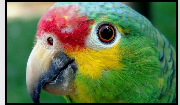
Amazona autumnalis