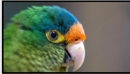
Eupsittula canicularis