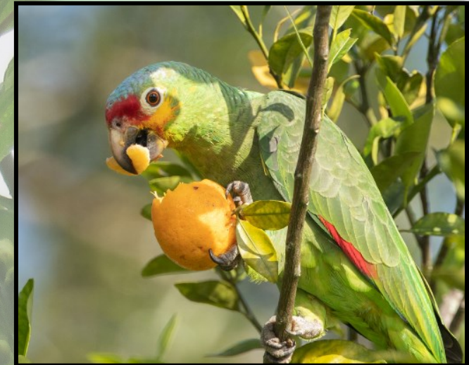
Amazona autumnalis alimentándose

Los Psitácidos se alimentan en su mayoría de semillas y frutos, lo que los convierte en excelentes regeneradores del bosque, ya que después de ingerir frutos y semillas, estas son expulsadas en sus heces, las cuales sirven de fertilizante para la germinación y desarrollo de las semillas.