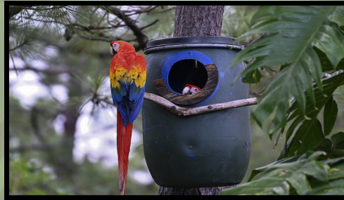
Nido artificial de Ara macao.

Existen diversas estrategias de conservación, como son los nidos artificiales para incentivar la presencia de estas especies en los bosques de pino, así como el establecimiento de áreas de protección. Sin embargo, es vital que las comunidades abandonen la práctica de compra de fauna silvestre, para desincentivar el tráfico de animales y evitar su extinción local. Para esto, es necesario implementar programas de educación ambiental intensivos y lograr empatía y concientización en la población.