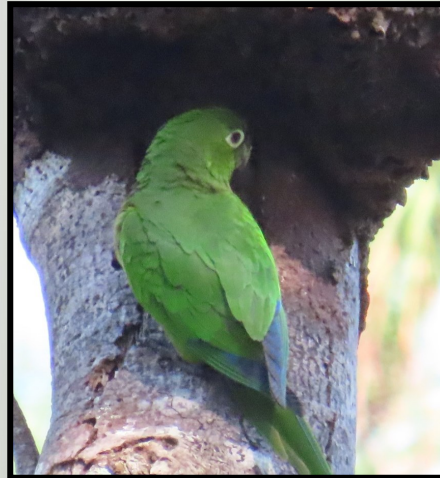
Eupsittula nana