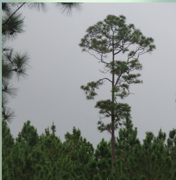
Imagen: Árbol semillero con su regeneración establecida.

PROGRAMA DE PROMOCIÓN SOCIAL FORESTAL RESPONSABLE TRIFOLIO No. 37